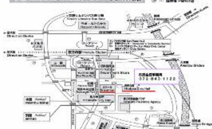
枚方市駅・枚方市役所周辺図 Hirakata Central Area Map